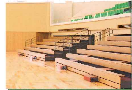
アリーナ移動式観覧席