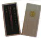
▲ 筷子的初筷 ※ お箸初めの箸

※“初箸”是一个健康成长的婴儿仪式的愿望，是我生命中的第一次给宝宝餐。 「お箸初め」とは、赤ちゃんの健やかな成長を願い、赤ちゃんに生まれてはじめてご飯を食べさせる儀式です。