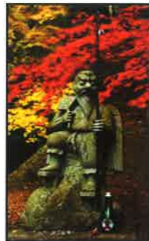
▲ 天狗 天狗

著藏寺向北大约 23 公里的地方有一座很大的神社 -- 「金刀比罗宫」。有「天狗」将「金刀比罗宫」祭祀时使用的筷子运到这座山上的传说。著藏寺的主佛和金刀比罗宫自古以来交情甚深。也被称作「金比罗内殿」。也许这个传说就是印证着两院的关系吧。